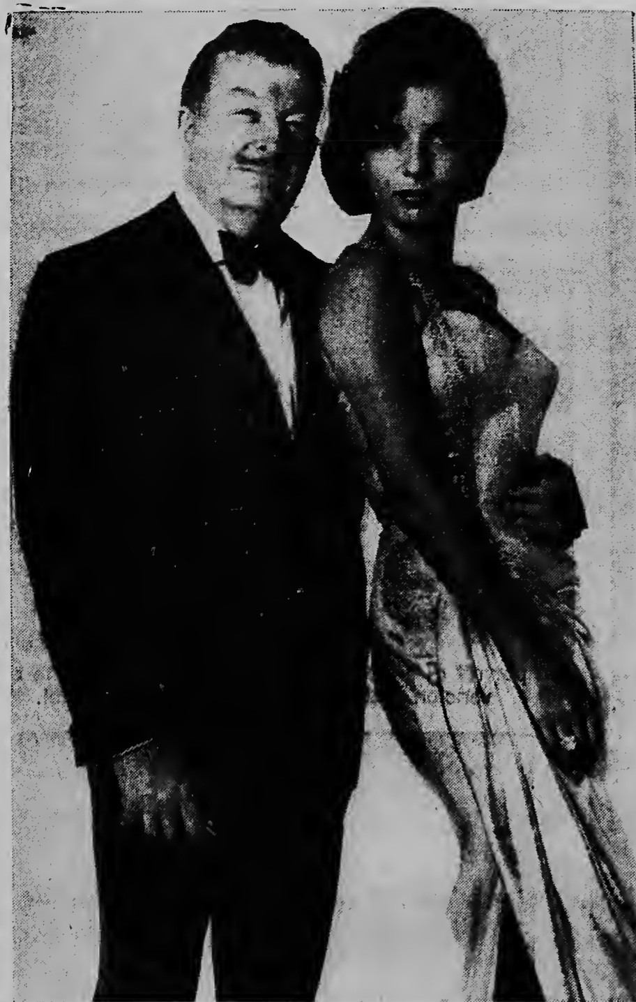
XAVIER CUGAT WITH ABBE LANE